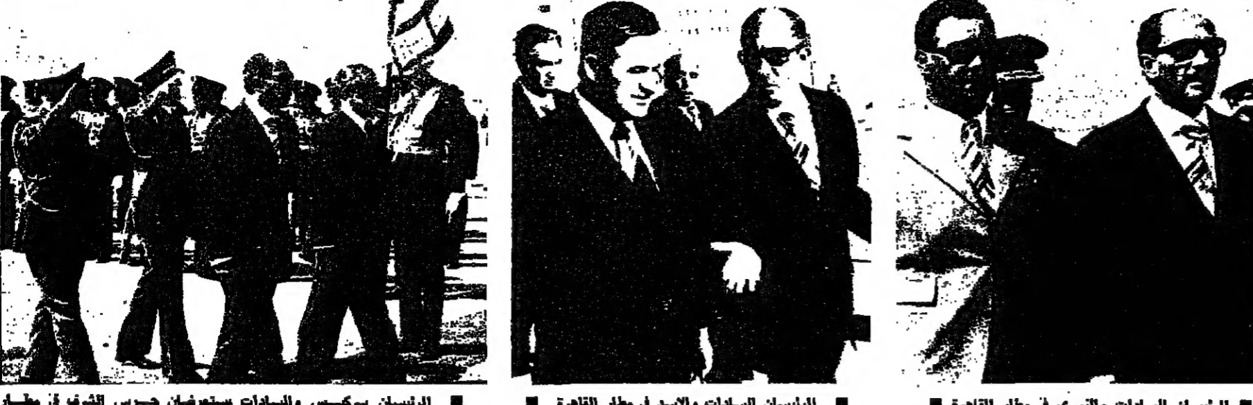
الرئيسان سركيس والحسين في مطار القاهرة